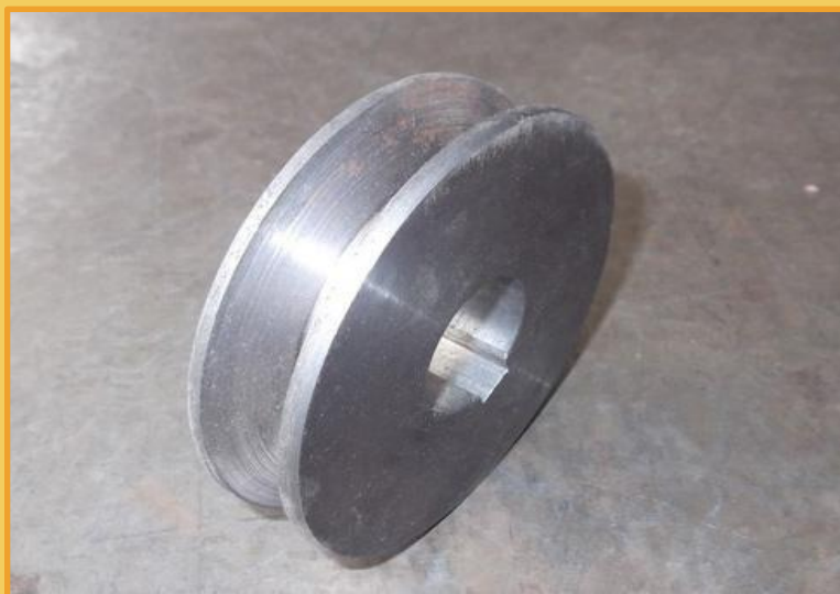
Литой чугунный шкив – дешево, но недолговечно