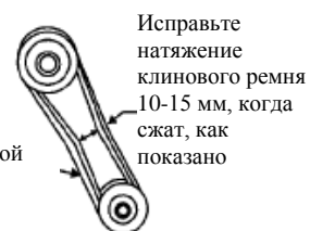
Рисунок 2. Натяжение клинового ремня

ВНИМАНИЕ НИКОГДА не пытайтесь проверить клиновой ремень при работающем двигателе. В случае попадания рук между клиновым ремнем и сцеплением возможны серьезные травмы. Всегда используйте защитные перчатки.