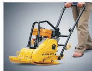
Ковер для укладки клинкерной плитки.