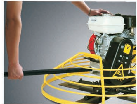
Труба для переноски.