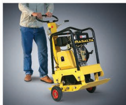
Транспортировочные колеса входят в комплект поставки.